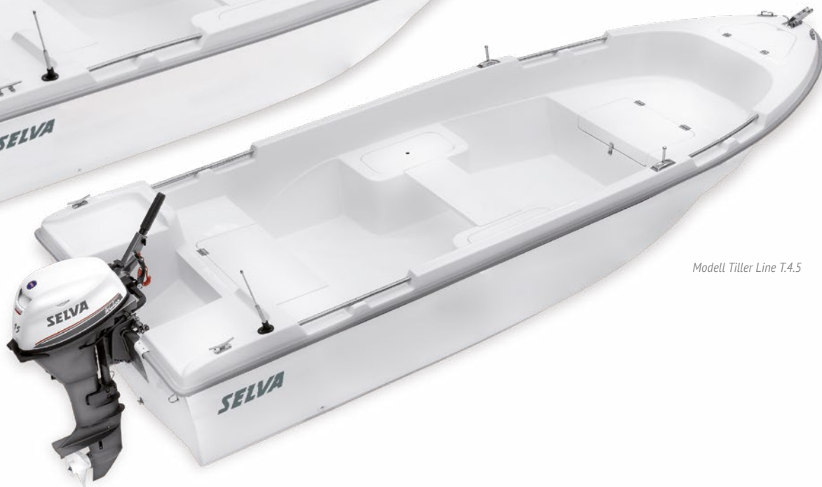
Modell Tiller Line T.4.5