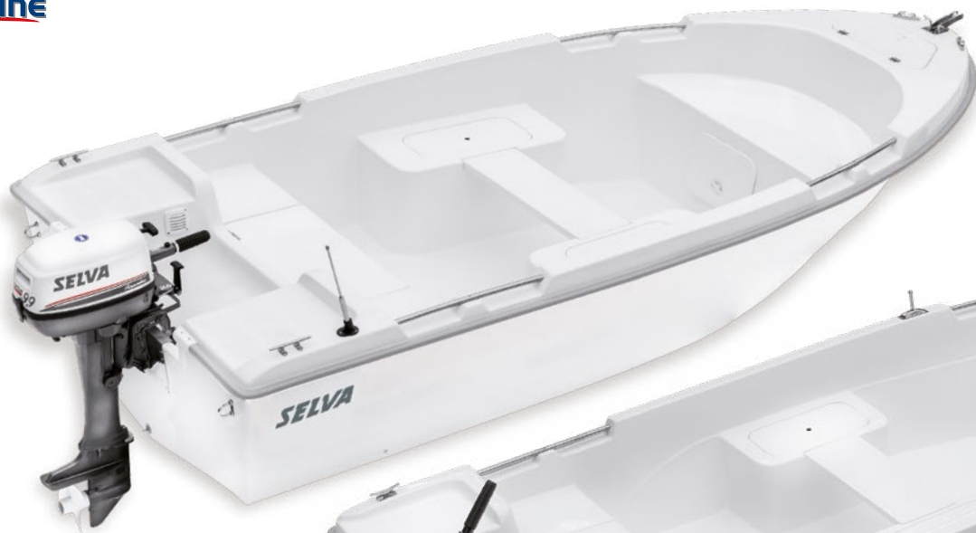
Modell Tiller Line T.4.0